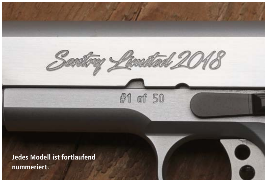
Jedes Modell ist fortlaufend nummeriert.