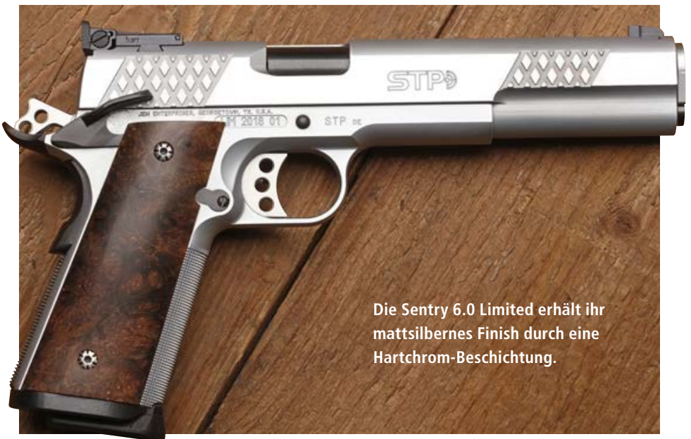
Die Sentry 6.0 Limited erhält ihr mattsilbernes Finish durch eine Hartchrom-Beschichtung.